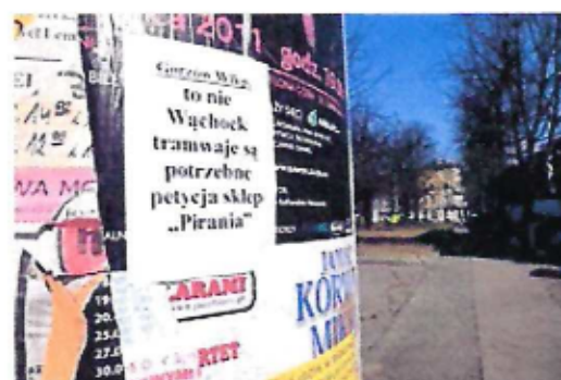
Plakat zachęcający do podpisywania petycji w Gorzowie Wielkopolskim

Przedmiotem petycji może być żądanie, w szczególności, zmiany przepisów prawa (petycja może zawierać projekt ustawy lub uchwały), podjęcia rozstrzygnięcia lub innego działania w sprawie dotyczącej podmiotu wnoszącego petycję, życia zbiorowego lub wartości wymagających szczególnej ochrony w imię dobra wspólnego, mieszczących się w zakresie zadań i kompetencji adresata petycji [8] .